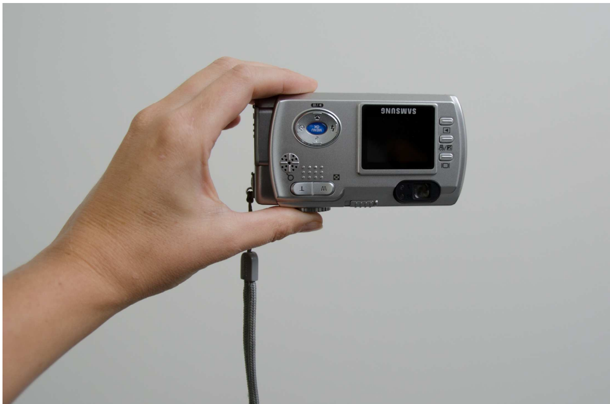
Figuur 15: Eerste methode voor linkshandige bediening van een compactcamera