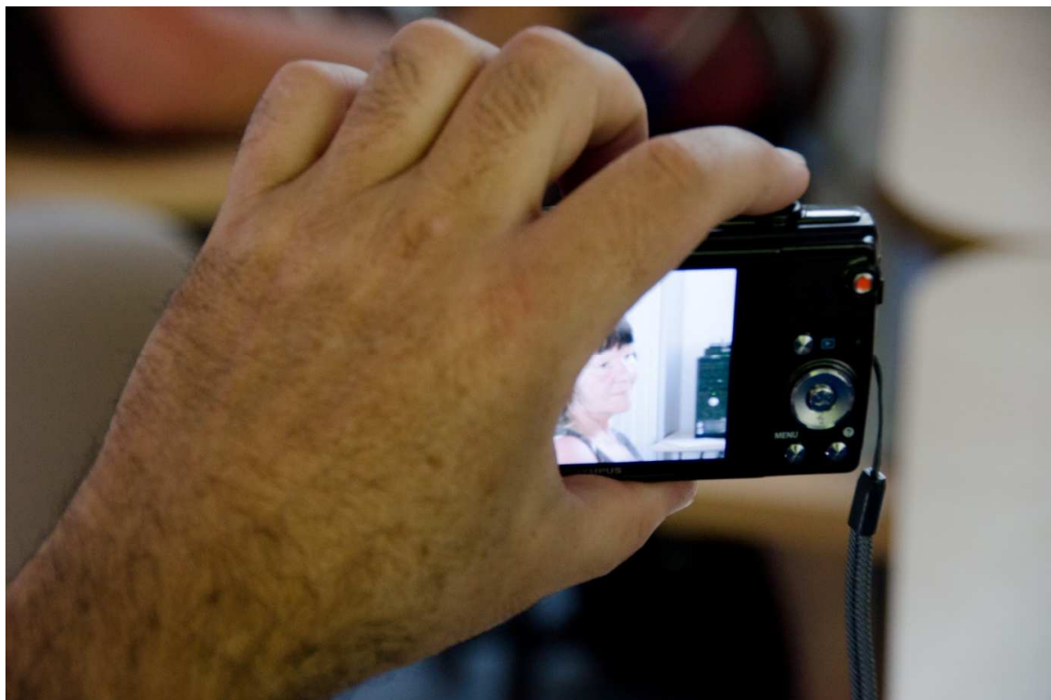
Figuur 16: Tweede methode voor linkshandige bediening van een compactcamera